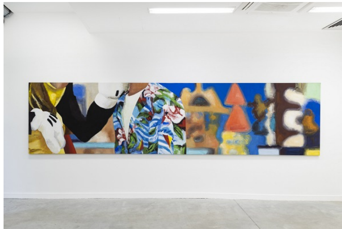
© Carole Benzaken "Disneyland Paris" 1996

Adresse : 16 place de Jaude, 63000 Clermont-Fd