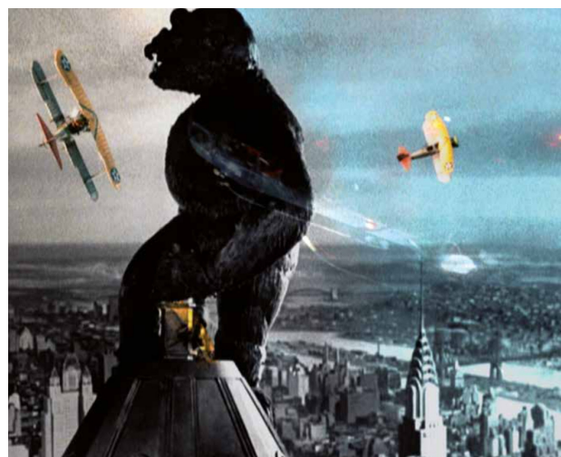
© Camille Henrot 'Colored planes' 2007 Dépôt du Cnap au FRAC Auvergne

Dans le cadre du programme du 20ème anniversaire, l'exposition Prix Marcel Duchamp est organisée en partenariat avec le FRAC Auvergne. Intitulée " Plus haut que les nues ", elle présente 19 artistes, lauréats et nommés du prix, sur deux lieux :