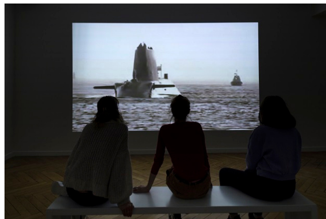
© Clément Cogitore "Un archipel" 2011

Vues de l'exposition au FRAC Auvergne « Plus haut que les nues - 20e anniversaire du Prix Marcel Duchamp »