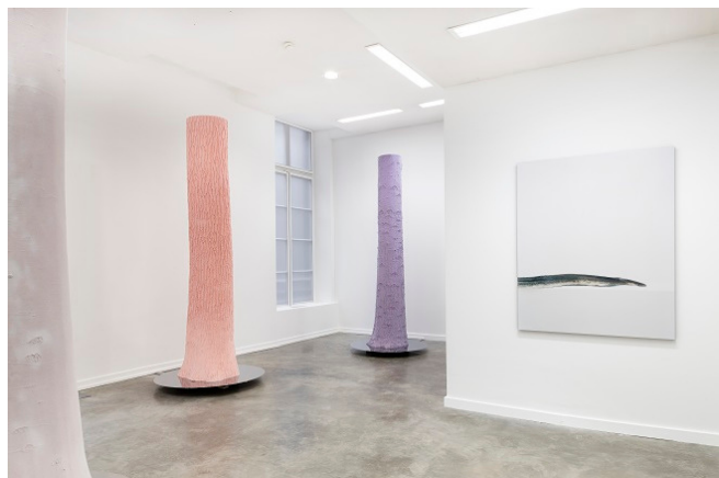
© Didier Marcel "Sans titre" 2002 ; © Eric Poitevin "Sans titre" 2010