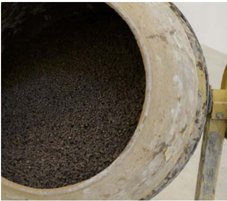
Kader Attia, Parfum d'exil , 2018