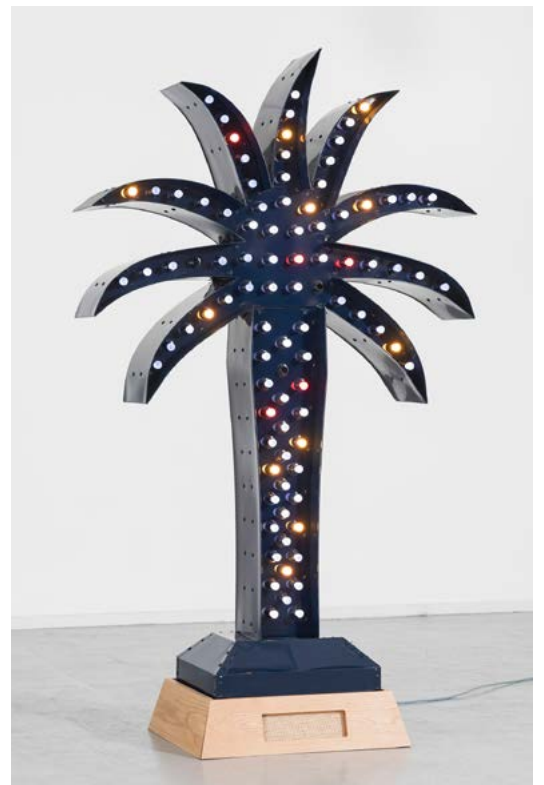
Yto Barrada, Green palm , 2016

Photographie digitale 235 x 140 cm