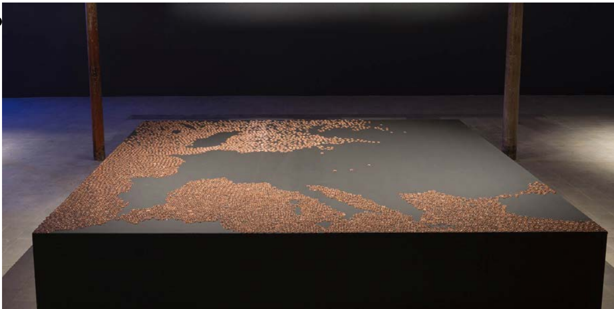
Enrique Ramirez, 4820 brillos (4820 faisceaux), 2017

4820 pièces en cuivre sur socle en bois 250×250×40 cm