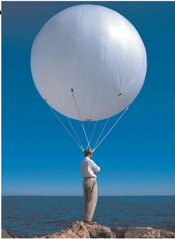
Philippe Ramette, Sans titre (Éloge de la Paresse) , 2000

Photographie couleur Épreuve numérique montée sur aluminium 159,5 x 131,5 x 5 cm Inv. FNAC 2000-680. Centre national des arts plastiques © Adagp, Paris 2021