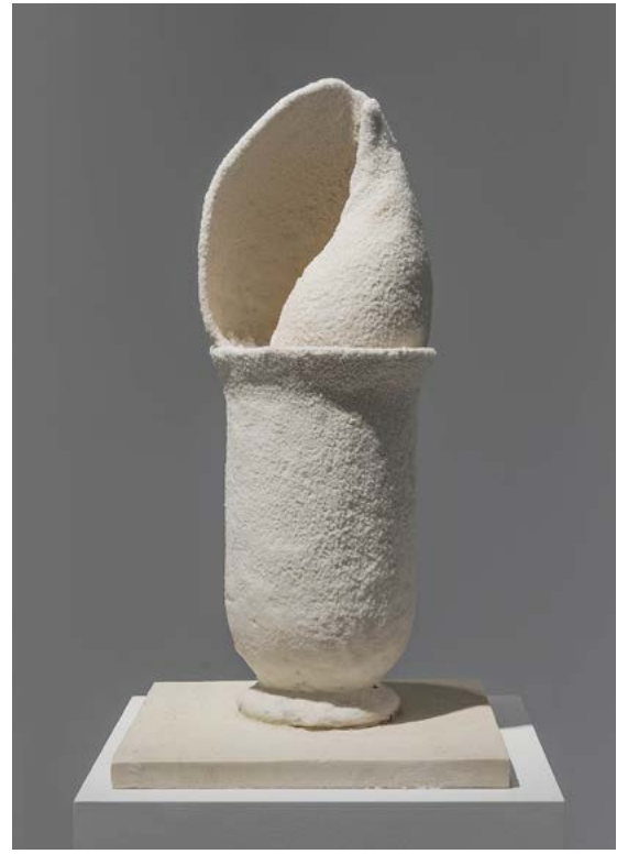
Michel Blazy, Vamos a la playa , 2017

Photographie couleur Épreuve numérique montée sur aluminium 159,5 x 131,5 x 5 cm Inv. FNAC 2000-680. Centre national des arts plastiques © Adagp, Paris 2021