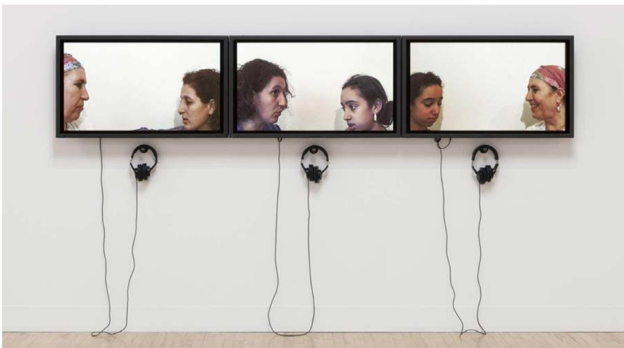
Zineb Sedira, Mother Tongue, 2002

Courtesy de l'artiste et galerie Michel Rein, Paris/Brussels © photo droits réservés © Adagp, Paris 2021