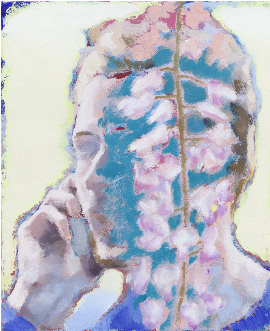
Ta voix dans les glycines I 2020 huile sur toile 27 x 22 cm