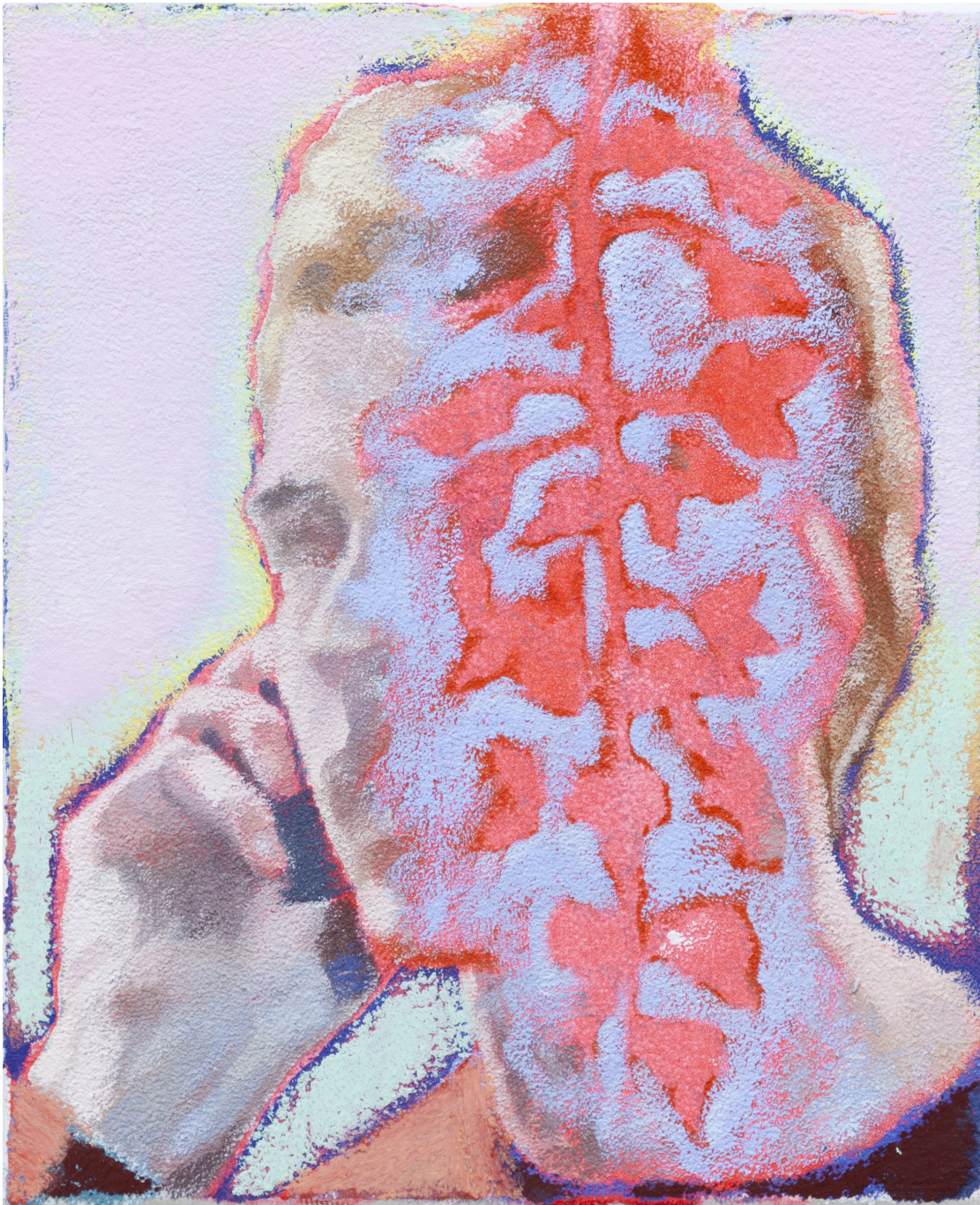
Ta voix dans les glycines III 2020 huile, acrylique et pastel gras sur toile 27 x 22 cm