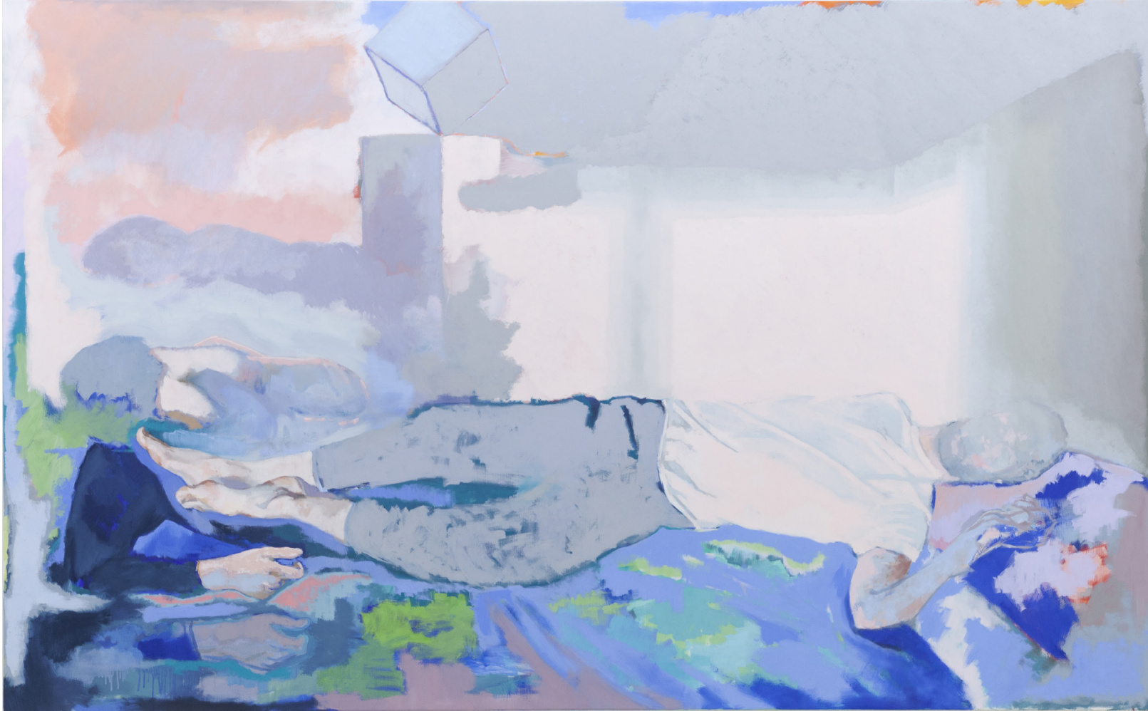
Sur le lit, ton T-shirt a la clarté du jour 2020 huile sur toile 160 x 260 cm