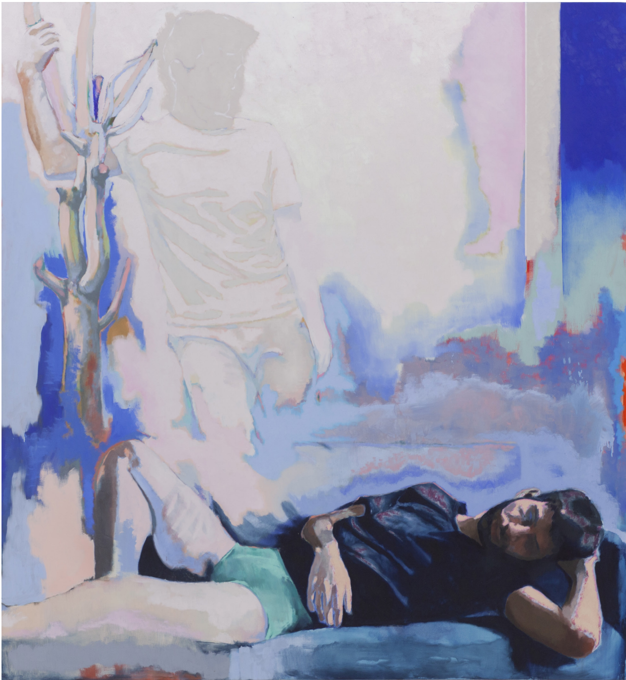
Ton absence laisse des traces sur le plâtre des murs 2020 huile sur toile 195 x 180 cm