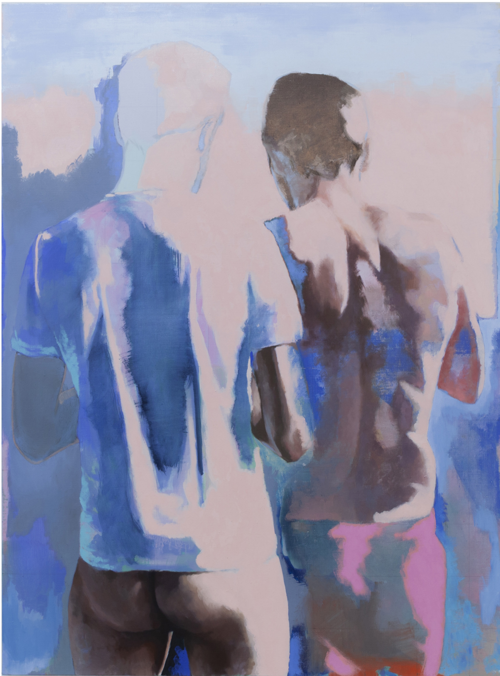
Ton corps s'illumine de l'écume des écrans 2020 huile sur toile 130 x 97 cm