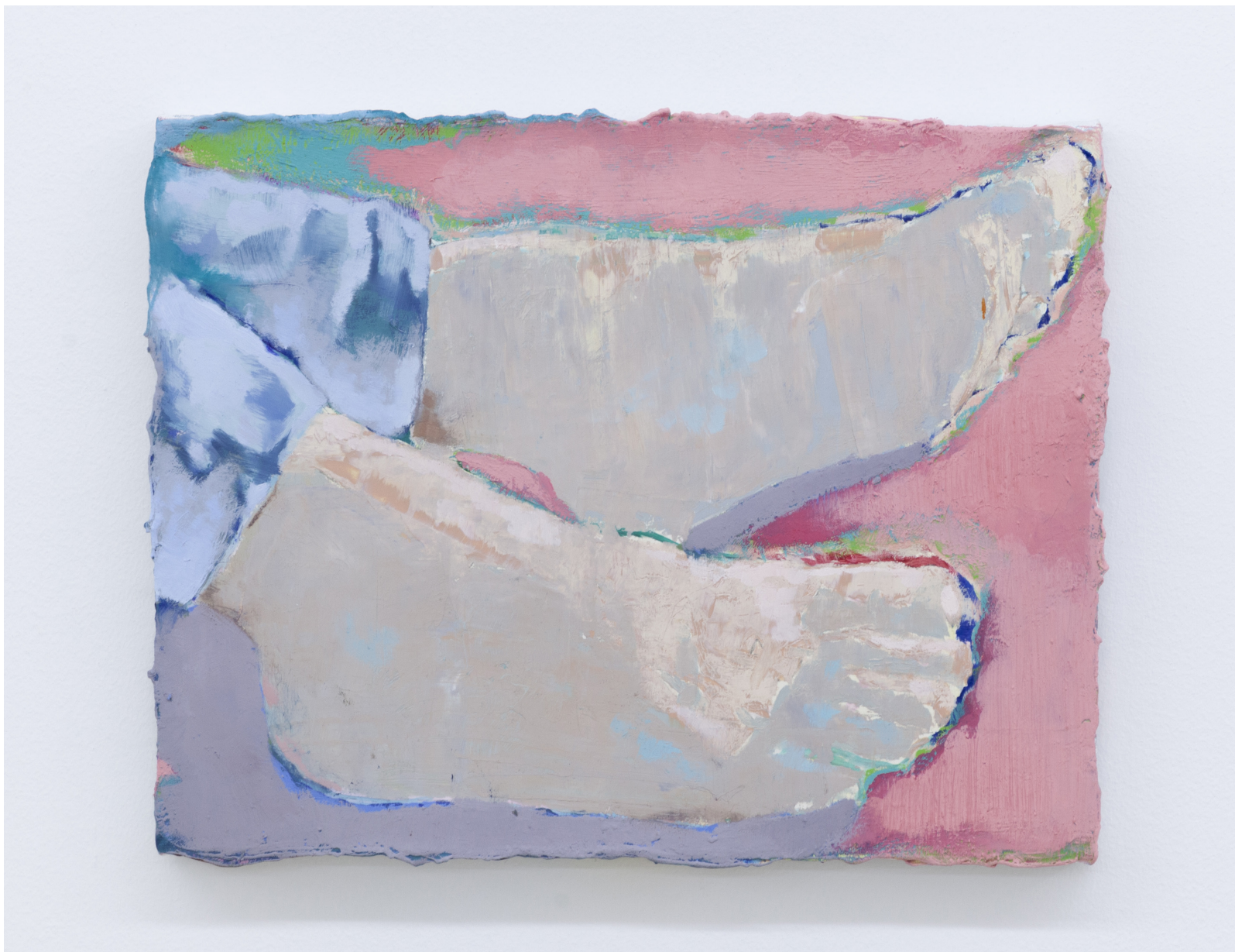
Les pieds nus sur le toit 2020 huile sur toile 25 x 33 cm