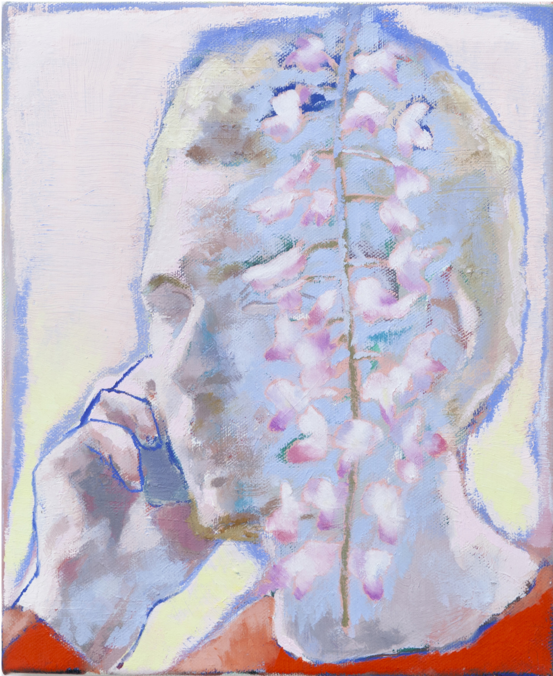
Ta voix dans les glycines II 2020 huile sur toile 27 x 22 cm