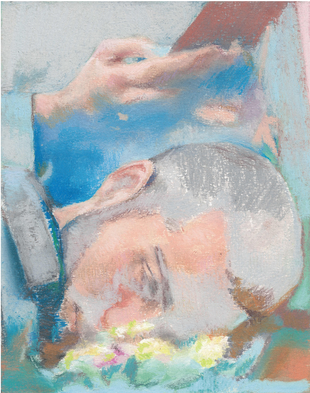
Sans titre, bouquet de fleurs et smartphone 2020 pastel sec sur papier 24 x 19 cm (sans cadre) 32 x 27 cm (avec cadre)