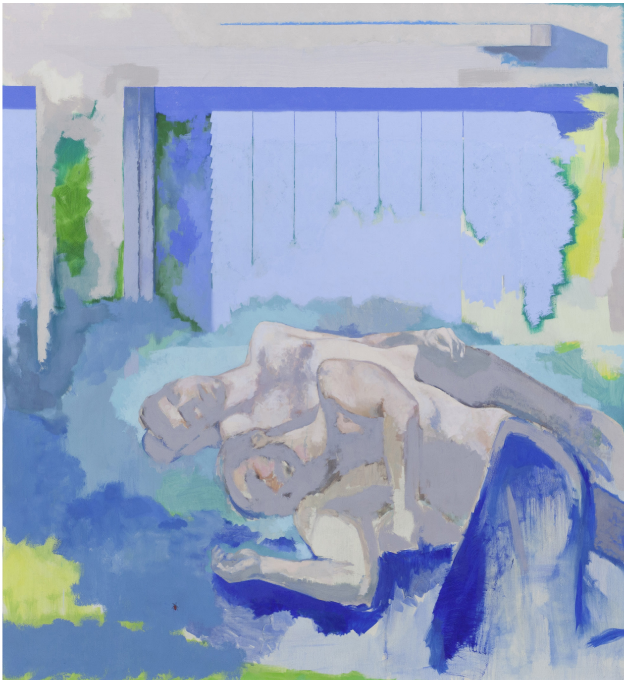
Sans titre, couple devant un volet bleu 2019 huile sur toile 195 x 180 cm