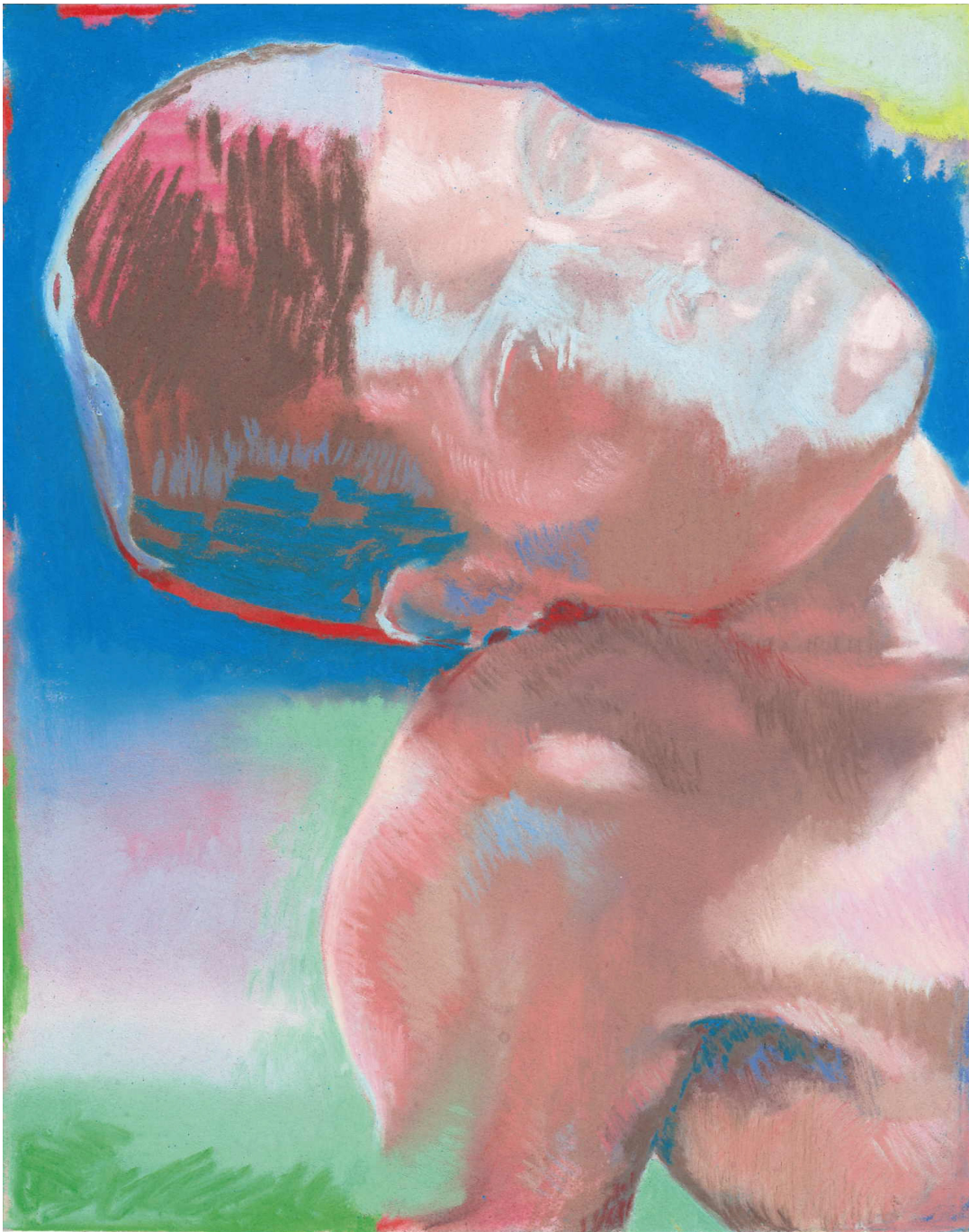
Portrait au soleil gris 2020 pastel sec sur papier 24 x 19 cm (sans cadre) 32 x 27 cm (avec cadre)