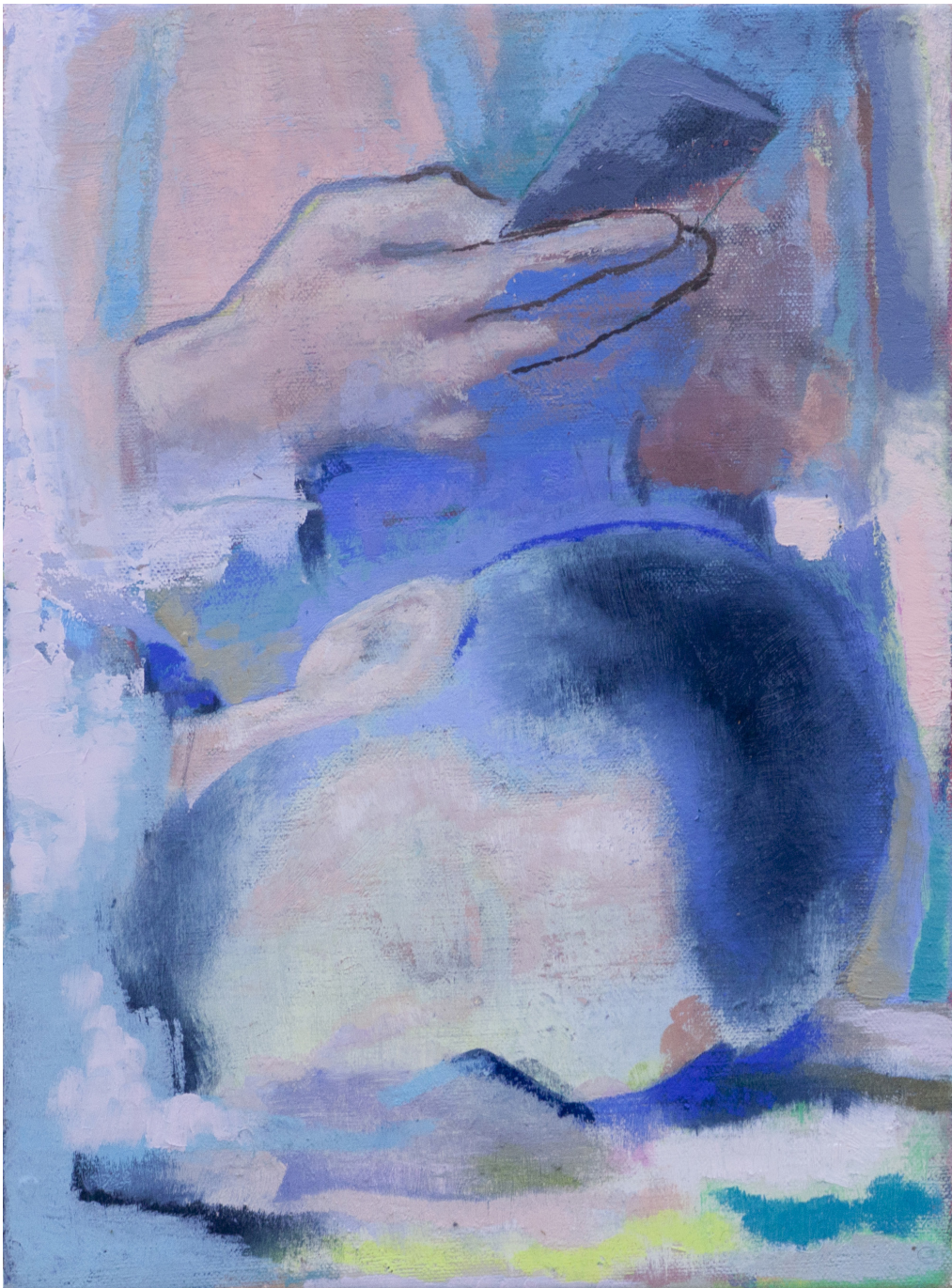
Prends moi en photo 2020 huile sur toile 33 x 25 cm