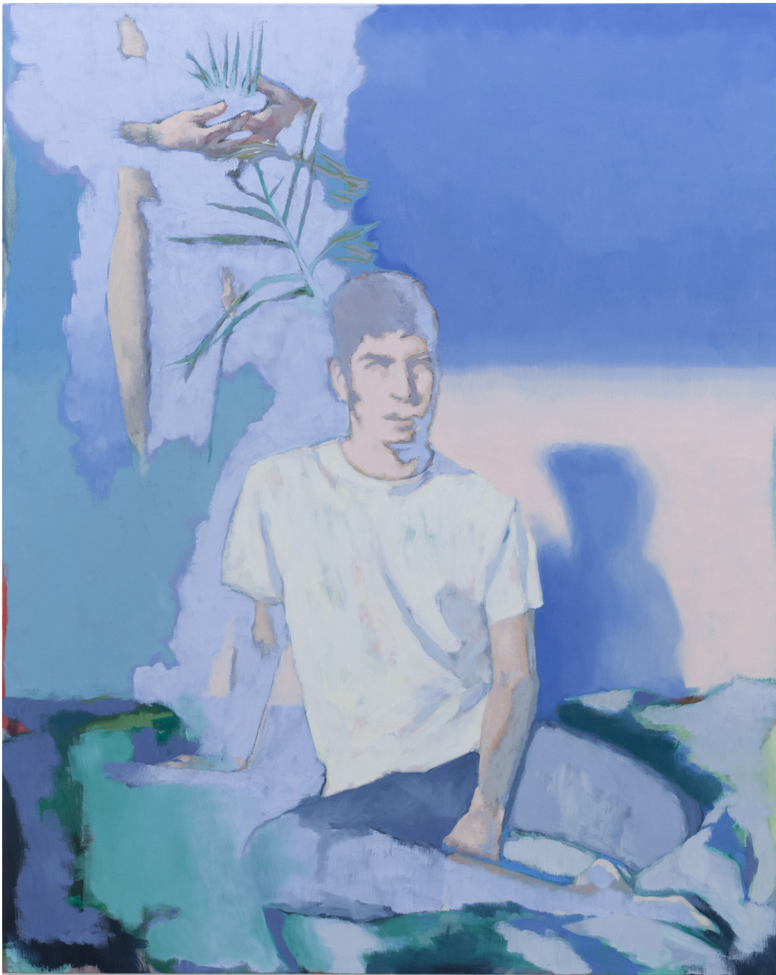
14h sur le lit 2020 huile sur toile 162 x 130 cm