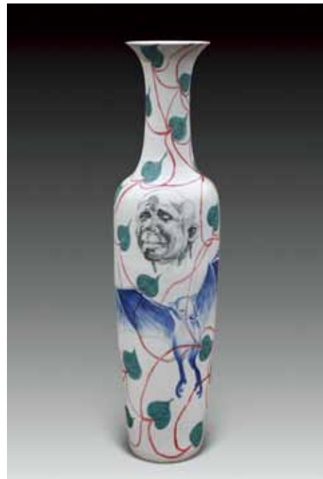
Barthélémy Togo Vaincre le virus! , 2016 Porcelaine émaillée Pièce unique 200 cm (haut) x 50 cm (diam)