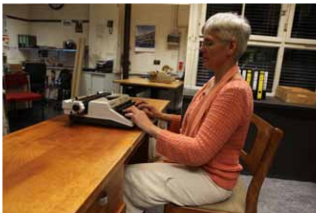
Kader Attia Extraits du film-essai « Réfléchir la Mémoire », 2016 courtesy l'artiste, Galleria Continua, Galerie Nagel Draxler, Lehmann Maupin, et Galerie Krinzinger crédit photo : Kader Attia © Adagp, Paris 2016