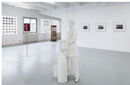
VUE DE L'EXPOSITION STUTTERING À LA GALERIE CHANTAL CROUSEL (12 DÉCEMBRE 2014 - 6 FÉVRIER 2015)