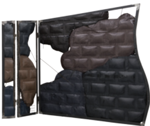
SÉRIE « SECURED WALLS » , 2014, MOUSSE EXPANSIVE, PIGMENTS, BOIS ET ACIER, CA. 175 X 230 X 45 CM, UNIQUE

Extrait du catalogue Prix Marcel Duchamp 2015 (texte d'Emilie Renard)