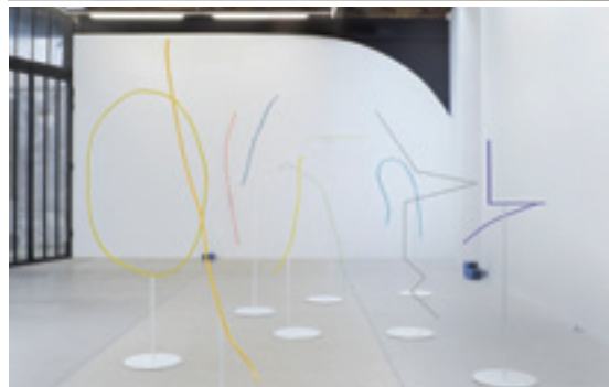
VIEW OF THE EXHIBITION _A JOURNEY THROUGH YOU AND THE LEAVES_, GALERIE FRANK ELBAZ, PARIS (2015)