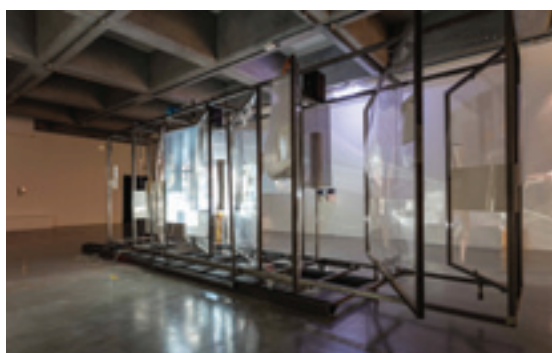
SUPERLATIVES AND RESOLUTION, PEOPLE PASSION, MOVEMENT AND LIFE , 2014, INSTALLATION VIDÉO, TECHNIQUE MIXTE, DIMENSIONS VARIABLES, UNIQUE VUE D'INSTALLATION : « 9 TH TAIPEI BIENNIAL », TAIPEI, TAIWAN, 2014