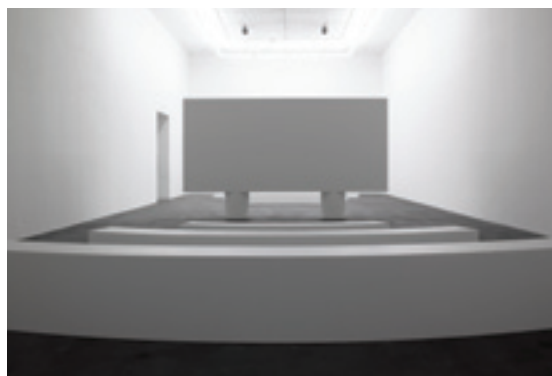
VUE DE L'EXPOSITION STUTTERING À LA DOUANE / GALERIE CHANTAL CROUSEL (12 DÉCEMBRE 2014 - 6 FÉVRIER 2015)