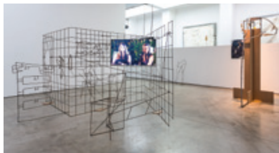
VUE D'INSTALLATION : NEÏL BELOUFA, « COUNTING ON PEOPLE », INSTITUTE OF CONTEMPORARY ARTS - LONDON (ICA), LONDRES, UK, 2014