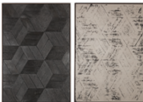
BURNT PAINTING. IMPRINT OF THE BURNT PAINTING (DOUBLE CUBES) (2013), BOIS CALCINÉ, POUSSIÈRE DE BOIS CALCINÉ SUR TOILE, 195 X 130 CM CHAQUE, © ZARKO VIJATOVIC

Extrait du catalogue prix Marcel Duchamp 2015 (texte de Jean-Max Colard)