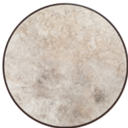
RIVER PAINTING (TORSEY CREEK, MAINE) (2014), SÉDIMENTS SUR TOILE, 178 CM DE DIAMÈTRE, © RAPHAEL FANELLI, COURTESY GALERIE FRANK ELBAZ