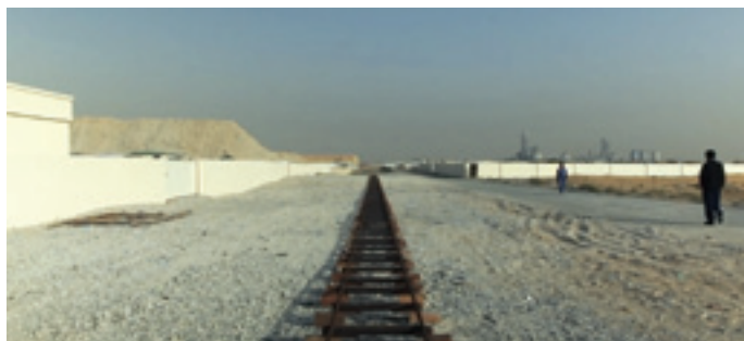
DAYS, I SEE WHAT I SAW AND WHAT I WILL SEE, 2011 VIDÉO HD, SON - DOUBLE PROJECTION SYNCHRONISÉE, 42MIN

Extrait du catalogue prix Marcel Duchamp 2015 (texte de Jean-Christophe Royoux)