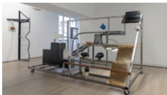
VUE D'INSTALLATION : NEÏL BELOUFA, « EN TORRENT ET SECOND JOUR », FONDATION D'ENTREPRISE - RICARD, PARIS, FRANCE, 2014