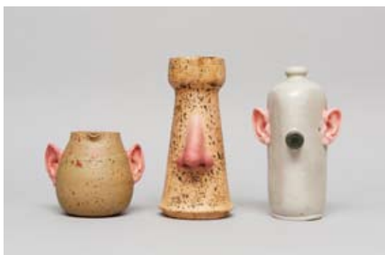
Les Demoiselles d'Avignon, poteries, 2013, photo Erwan Fichou

Extraits catalogue prix Marcel Duchamp 2014 (texte Stéphane Corréard).