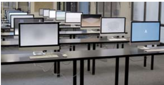
Anomalies construites, 2011 Vidéo HD, 8 min. Image : Vincent Bidaux, Christophe Bourlier, Robin Kobrynski. Son : Super Sonic Productions. Voix : Olivier Clavierie. Production galerie Edouard-Manet de Gennevilliers. Courtesy galerie Jousse Entreprise. Photo Copyright : Julien Prévieux

Extraits catalogue prix Marcel Duchamp 2014 (texte Elie During).