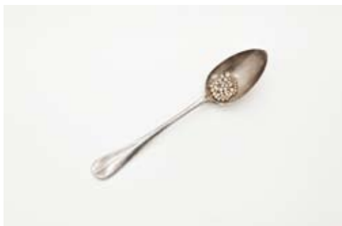
«Je suis une caverne» (2010) Cullière en argent, 61 perles de caverne, 20 x 5 x 4 cm

Extraits catalogue prix Marcel Duchamp 2014 (texte Florence Ostende)