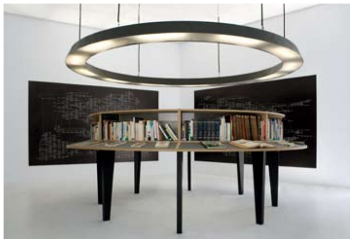
La totalité des propositions vraies (avant), 2008 Livres, chêne, contreplaqué, métal, diamètre : 380cm, hauteur : 155cm