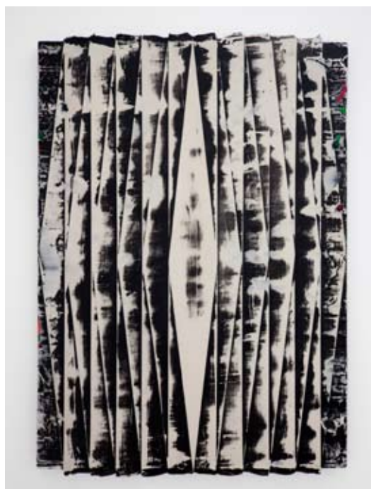
Stripe Painting 7.

2 channel video installation courtesy of the artists & Crèvecoeur, Paris