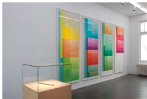
Continuum 5 (2013) Vue de l'exposition «Continuum», Meessen De Clercq, Bruxelles Arrière plan : Evariste Richer, Geological Scale , 2009 Inkjet print on paper, 270 x 110 cm (each) Avant plan : Evariste Richer, Le Mètre Lunaire , 2012 Copper, 27,27 cm