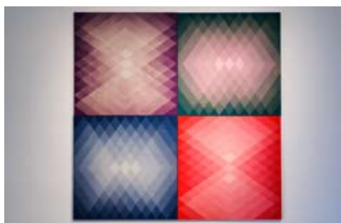
Untitled losange 2.

Extraits catalogue prix Marcel Duchamp. (texte Pascal Rousseau)