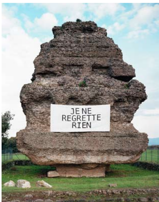
Je ne regrette rien photographie argentique 160X200 cm, 2014, avec Erwan Fichou