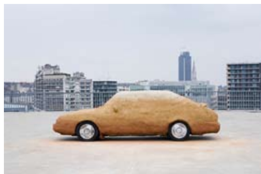
C'était mieux demain sculpture, 2013