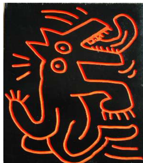
Keith Haring - Sans titre, 1983 - Peinture émaillée sur bois - 24 x 40 x 3 cm - Collection Marie-Françoise et Gilles Fuchs

- Sans titre / 1983 / 25 x 40 x 3 cm / peinture émaillée sur bois