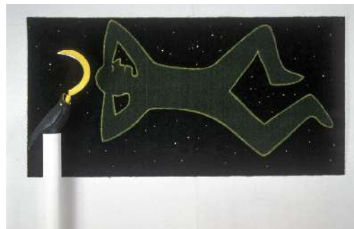
Daniel Tremblay – Sans titre, 1982 200 x 300 cm - Gazon synthétique, corbeau caoutchouc, faucille, perles

- Sans titre / 1982 / 200 x 300 cm / gazon synthétique, corbeau caoutchouc, faucille, perles