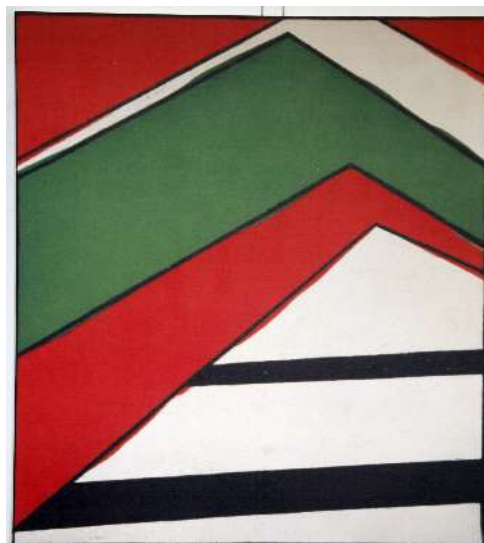
Bertrand Lavier Walt Disney production N°2 – DDR6747, 2009 Jet d'encre sur toile - 115 x 92 cm - Collection Marie-Françoise et Gilles Fuchs

- Walt Disney production N°2 - DDR6747 (Ed. ½, 1947-2009) / 2009 / 115 x 92 cm / jet d'encre sur toile