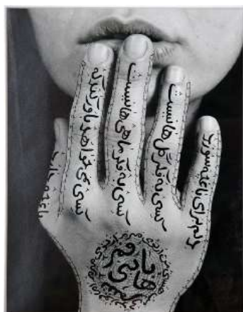
Shirin Neshat – Sans titre, 1996 Photographie - 23 x 33 cm - Collection Marie-Françoise et Gilles Fuchs

- Sans titre / 30 x 42 cm / encre sur papier