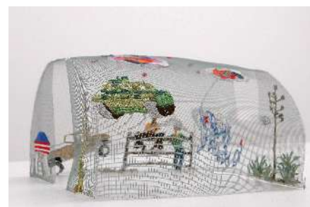
Isa Melsheimer Unfinished building, 2005 Métal, fil tissé - 32 x 32 x 20 cm - Collection Marie-Françoise et Gilles Fuchs

- Tuch IV / 2007 / 128 x 100 cm / broderie tissu