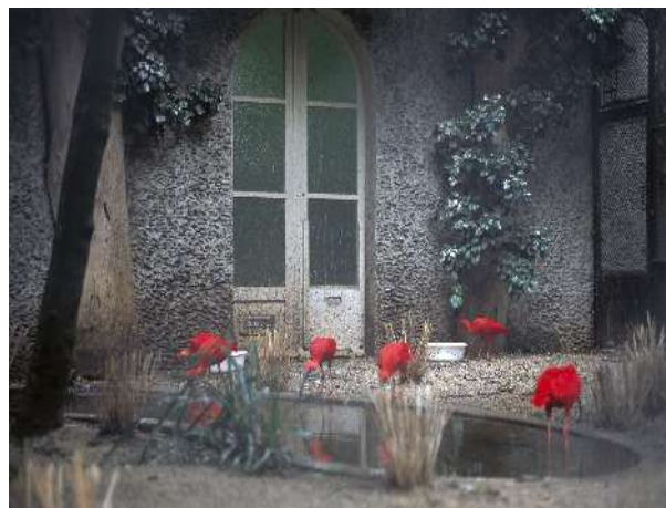
Cedrick Eymenier Corocoro rojo, 2008

- Le Buisson ardent - # 072124 Amsterdam / 2007 / 48 x 32,5 cm / photographie