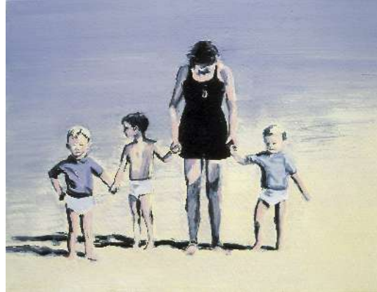
Adam Adach - Mothers Sister Son, 2005 - Huile sur toile 50 x 65 cm - Collection Marie-Françoise et Gilles Fuchs

- Mother sister son / 2005 / 50 X 65 cm / huile sur toile