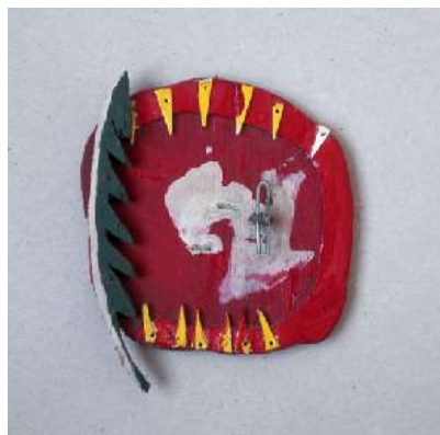
Richard Tuttle - BI, 1981 - Bois, carton, fil de fer, peinture acrylique - 13,3 x 10,5 x 2 cm - Collection Marie-Françoise et Gilles Fuchs