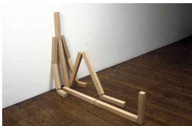
Markus Raetz - Mimi (n°7/11) / 1980 / dimensions variables / dix-neuf éléments en bois de hêtre

Jean- Pierre Raynaud / né à Courbevoie / vit et travaille à Paris