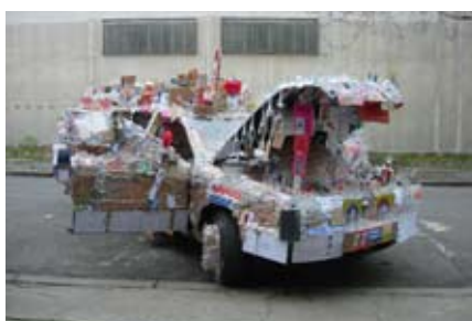
Thomas Hirschhorn Spinoza-Car 2009 Car, cardboard, book, glass, paper, paper print, various tape and plush, etc 210 x 480 x 220 cm Collection of the artist Installation view: Rue Henri Murger, Aubervilliers, France