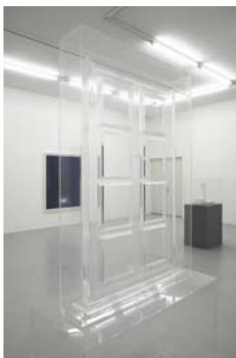
Mathieu Mercier Untitled 2007 Plexiglass 190 x 120 x 50 cm