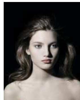
Valérie Belin Untitled 2006 Pigmented print 125 x 100 cm Collection: Emmanuelle et Jérôme-de-Noirmont, Paris