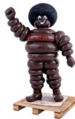
Bruno Peinado The Big One World 2000 Polystyrene foam, resin, polyurethane paint, wood 240 x 170 x 100 cm Collection: FRAC Poitou-Charentes, Angoulême, France