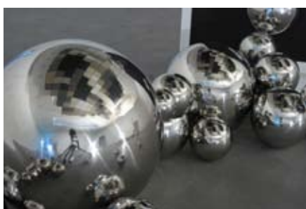
Saâdane Afif Skull 2008 Rockwool double ceiling, painted wood bases, stainless steel ball, lights variable dimension Installation view: "One," Frac des Pays de la Loire, 2008 Collection: Fonds National d'Art Contemporain, Paris